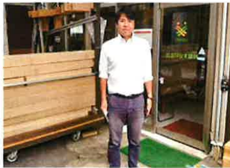
株式会社おりなす建材