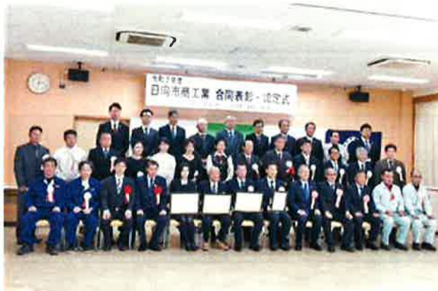
(写真撮影時のみマスクをはずしています)

また、「社員が輝く!先進企業」には、男女共同参画への取り組み、ワークライフバランスの推進、地域貢献への取り組み等が評価され、旭建設株式会社が認定されました。